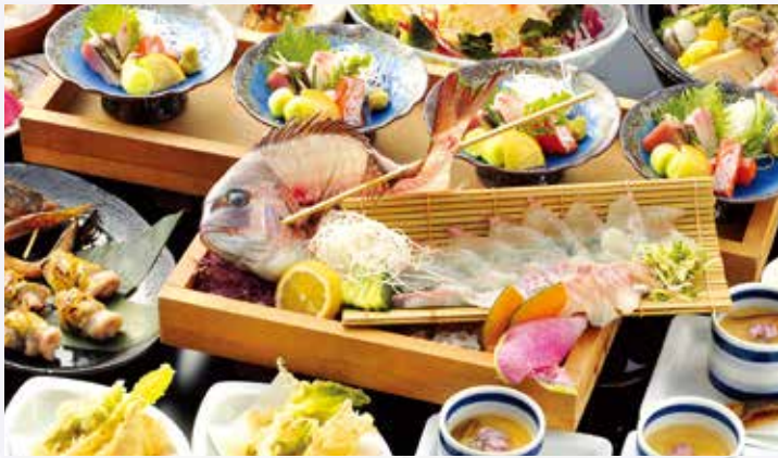
※写真はイメージです。実際とは異なります